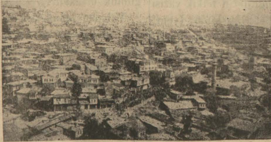
Kurtuluş günü kutulanan Maraş'tan bir görünüş

Binaenaleyh kanunun meclisimize bahşetmiş olduğu selâhiyetleri kullanarak hiç bir vakit geri kalmış olmak gibi bir vaziyete düşülmemesini ve bu toplantımızda çarşaf ve peçenin kaldırılmasının Belediye yasakları arasına alınmasını muhterem meclisi âliye teklif eylerim . »